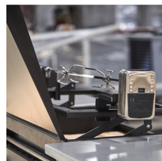
Opcional; Spiedo Eléctrico

RCUBO LTDA. www.rcubo.cl (+562) 2 202 5590