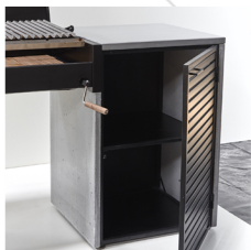
Repisas de Melamina Negra