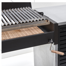
Parrilla BOSCA Acero Inox. con Alzador