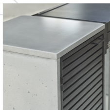
Cubiertas de Cemento Granítico